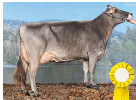
Platz 3 Nr. 202: Zora (Zeus × Tomba) von Ueli Bürkli/Schachen, SBZV, 1. La 7435 3,54 3,88, Schöneutersieg jung und Abteilungssieg Schweizer Braunvieh 2010 in Zug; 2 Abkalbungen.